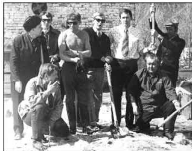
№ 49. Киногруппа 70-х годов