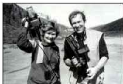
№ 48. На съёмках