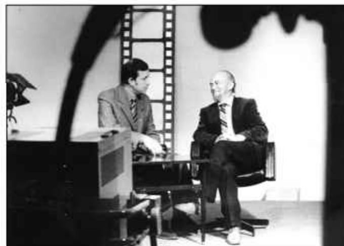
№ 53. Режиссёр И. Беляев