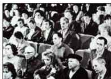
I Конференция «Контактёры Кузбасса»