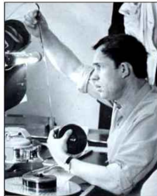
№ 46. В монтажной

А пока помещаю в книжку несколько фотографий после ВГИКовской поры и кадры из цикловых передач.