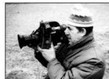
№ 47. На съёмках