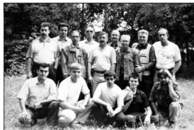
№ 50. Операторы 90-х годов