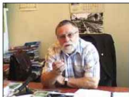
Поэт Борис Бурмистров