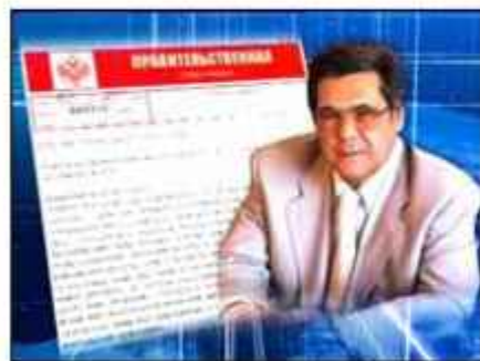
Губернатор Аман Тулеев