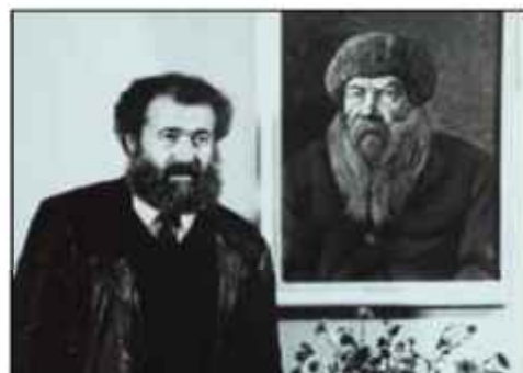
Кинорежиссёр М. Литвяков